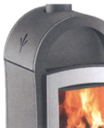
Vestre 368.19-WT anthrazit/silber